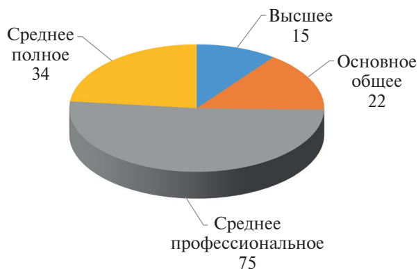
Рис. 3. Распределение преступников по уровню образования

ступление, имеет высшее образование: только 15 (чуть более 10 %). Думается, это связано с тем, что лица, имеющие высокий образовательный уровень, более законопослушны. Следующая группа по материалам исследованных уголовных дел – это лица, имеющие основное общее образование, – 15 %. Далее лица, имеющие полное среднее образование, – чуть более 23 %. Наконец, группа лиц, имеющих среднее профессиональное образование 8 , – более 51 %.